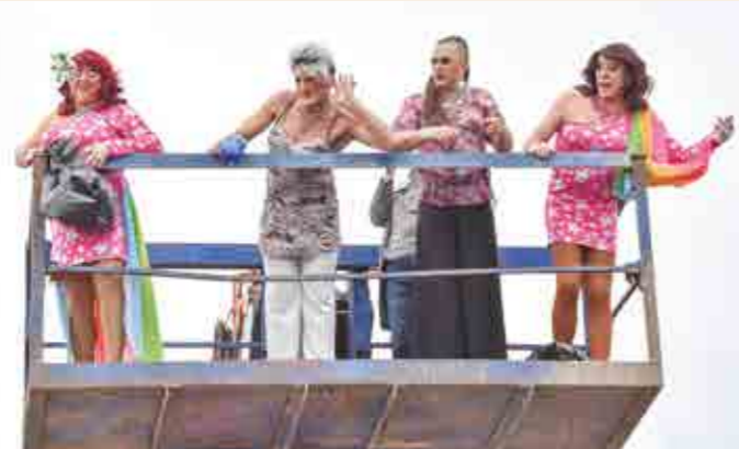
Inrichting: VZW SINT-BAVO VRIENDEN Sint-Baafs-Vijve. De Sint-Bavovrienden zijn ondertussen erkend als IMMATERIEEL ERFGOED