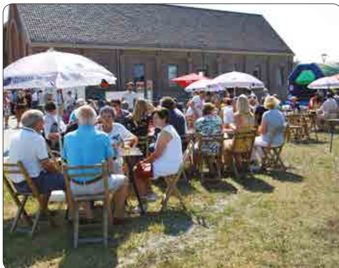
Inhuldiging dorpskern Sint-Baafs-Vijve 1 juli 2018