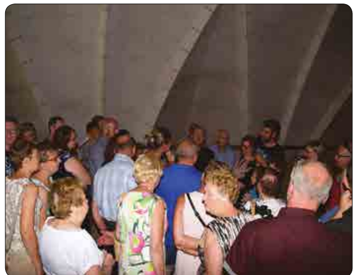
Opendeurdag Sint-Laurentiuskerk Wielsbeke 15 juli 2018