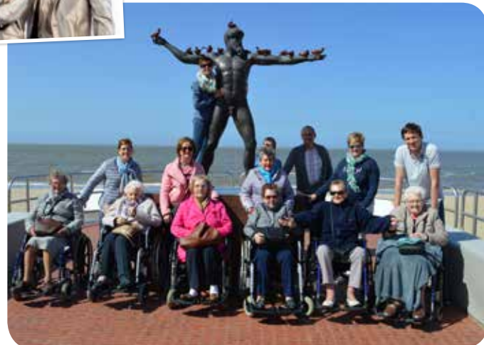
Bewoners van het woonzorgcentrum - Vakantie aan zee - april 2018